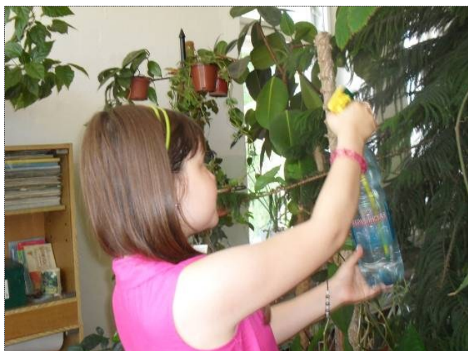
Фото: Ухаживаем за растениями в Зимнем саду Городской станции юных натуралистов.

21 июня ребята побывали на экскурсии в музее Отечественной войны, где познакомились с экспозициями, посвященными Кузбассовцам –