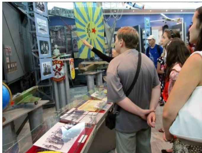
Фото: Экскурсия в «Музей Отечественной войны».

Для участников смены проведен праздник «День вежливости», где во время проведения ролевой игры ребята показывали своё умение вежли-