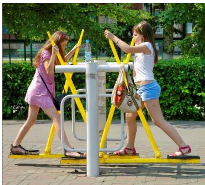
Фото: Спортивные игры в парке.

Для ребят проводились тренинги по дыханию, умению владеть собой, беседы по правильному питанию, здоровому образу жизни, опасности для здоровья вредных привычек, расслабляющая гимнастика под