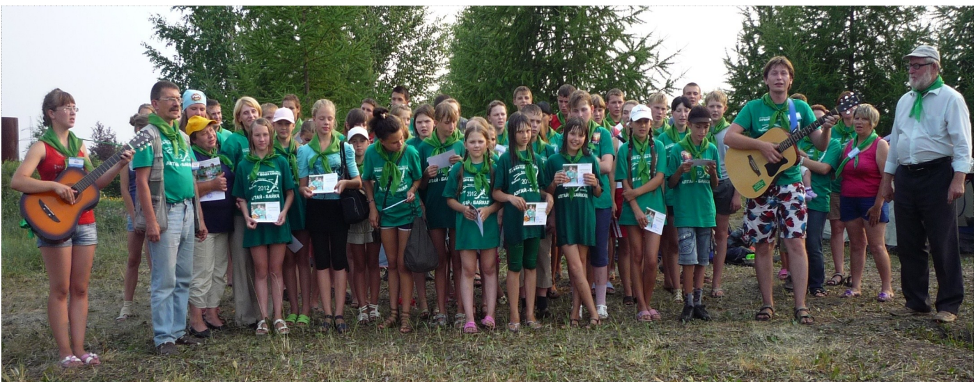
Фото: Участники экологической экспедиции «Начни с дома своего»